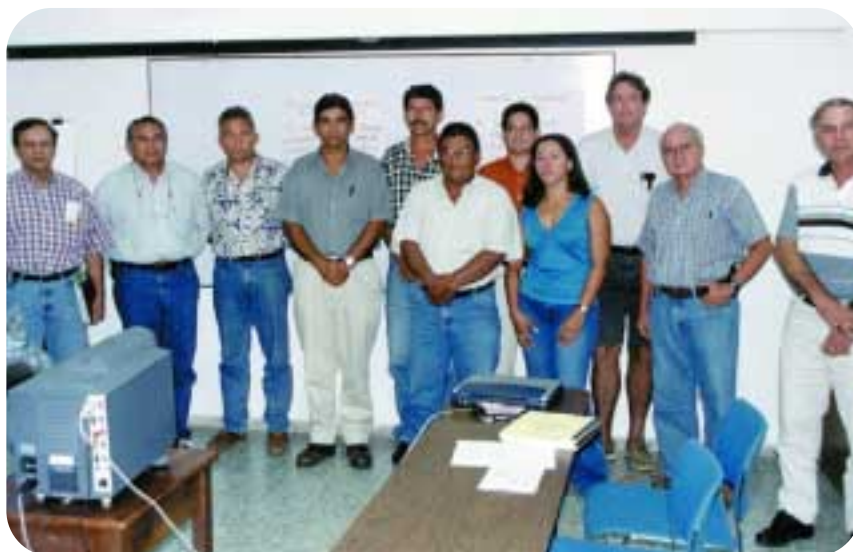
Miembros de la Junta Directiva de AHPROPINE.

negra nacional es de superior calidad comparada con la que actualmente se está importando.