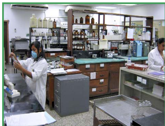
Vista parcial del Laboratorio Químico Agrícola de la FHIA.

Tomando en consideración que este laboratorio presta importantes servicios de análisis de suelos, de tejidos foliares, de agua, de alimentos concentrados para animales y de muchas muestras misceláneas enviadas por miles de productores hondureños y de otros países, y que la acreditación bajo la referida norma fortalecería significativamente la calidad de los servicios prestados, se aceptó la invitación y se inició desde entonces el proceso para lograr tan importante acreditación.