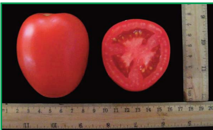
Características fenotípicas internas y externas del cultivar Namib.

En el transcurso de la jornada se conocieron los resultados obtenidos en la evaluación de 19 cultivares de tomate de proceso en los que destacan Namib, Tisey y DRD 8560 como los cultivares que superaron los 70,000 kg/ha en cuanto a rendimientos totales y comerciales. Además, se indicó que en general el descarte de producto se considera aceptable ya que fue menor al 10%, presentando el menor porcentaje de descarte el cultivar 15044 F1, con menos del 2%. En cuanto a los 10 cultivares de tomate de consumo fresco que fueron