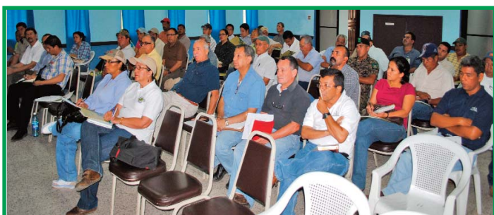
Participantes que asistieron a la presentación de resultados del Programa de Hortalizas.