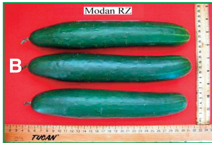
A. Frutos de pepino tipo holandés y B. Frutos de pepino tipo slicer .