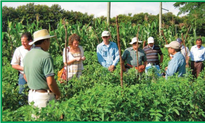
Las actividades de capacitación ejecutadas permiten transferir los resultados obtenidos en la investigación realizada en el CEDEH.

Adicionalmente informó que el personal técnico del CEDEH participó en diferentes eventos de capacitación tanto a nivel nacional como internacional, con el propósito de adquirir nuevos conocimientos y compartir las experiencias de la FHIA en el rubro hortícola. Es importante mencionar que cada año diversas instituciones educativas envían al CEDEH a sus estudiantes a desarrollar su práctica profesional o desarrollar sus trabajos de investigación para optar al título de Ingeniero Agrónomo, por lo que tres estudiantes se involucraron en el diario vivir de este Centro durante este periodo.