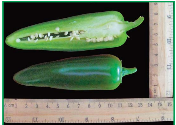
Características fenotípicas internas y externas del cultivar El Rey.

En Honduras es importante la producción de chile jalapeño y chile dulce para mercado interno y externo, por lo cual en este periodo se evaluaron 13 cultivares de chile jalapeño, en los que se destacaron por sus rendimientos comerciales el cultivar El Rey con 63,888.8 kg/ha y el cultivar HMX 8668 con 61,055.5 kg/ha. En cuanto a los 6 cultivares de chile dulce evaluados, se observó que en general presentaron buenas características de adaptación, buen crecimiento vegetativo, buen sistema de ramificación y sobre todo buena consistencia y coloración del fruto. Anaconda fue el cultivar que registró la mejor producción comercial por hectárea con 39,944.40 kg, presentó buenas características de formación de pisos y sobresale como una planta compacta; sin embargo, este cultivar registró un porcentaje medio de descarte de frutos (9.2%), principalmente por quemadura por sol.