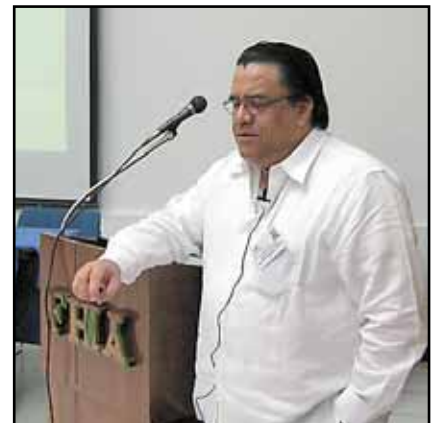
Ing. Arturo Corrales Álvarez, Ministro de Planificación y Desarrollo.

El Ing. Corrales también explicó en detalle los aspectos fundamentales del Plan de Nación, indicando que se ha dividido el país en seis regiones y que cada sector en forma organizada debe participar activamente en todo el proceso. “Yo espero que todos ustedes, que representan a uno de los sectores más importantes de la economía de este país, se incorporen al trabajo que se debe realizar en los Consejos Regionales de Desarrollo que próximamente serán organizados, donde podrán participar en la definición de los proyectos prioritarios que se deben ejecutar, e involucrarse en forma organizada en su ejecución. Sabemos que en este proceso, la FHIA jugará un papel protagónico”, concluyó el Ing. Corrales.