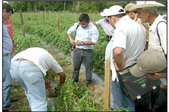
Productores y técnicos observando enfermedades en un cultivo de tomate en San Francisco del Valle, Ocoateque.