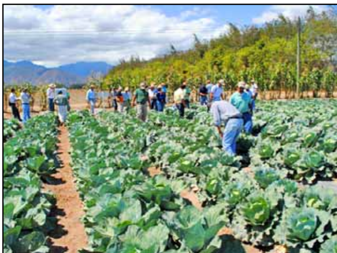
Los participantes observaron la adaptabilidad de los cultivares de repollo producidos en el CEDEH, Comayagua, Comayagua.

Al final del evento, los participantes manifestaron su satisfacción por la cantidad y calidad de las investigaciones que ejecuta la FHIA en el CEDEH, y reiteraron su reconocimiento a la Fundación por los aportes tecnológicos que ha hecho y que continúa haciendo para modernizar el sector agrícola de la zona y de otras regiones del país.