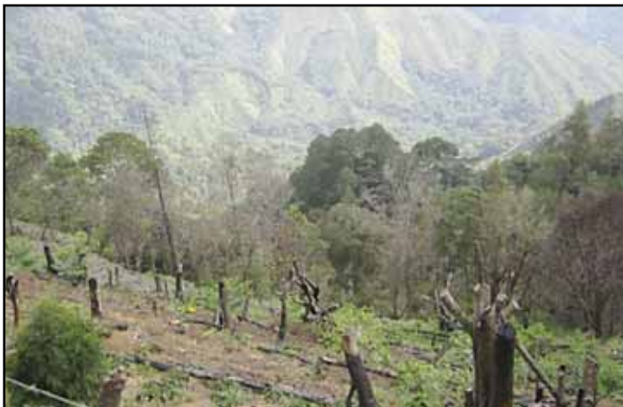
Vista panorámica de un sector de la microcuenca del río Manchaguala.