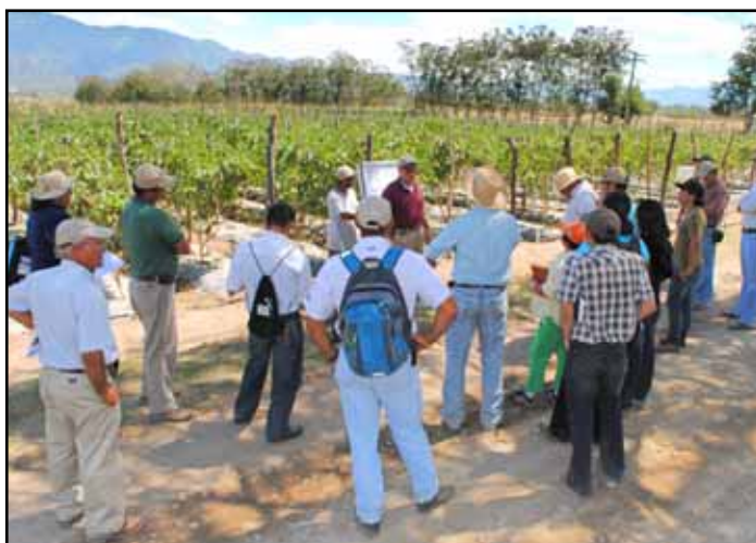
Los investigadores analizan con los participantes los avances obtenidos en la evaluación de poblaciones de chinches Orius y otros depredadores de plagas en el cultivo de berenjena.