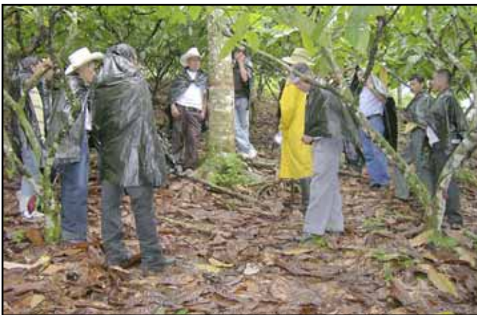
Productores participando en gira educativa por el litoral atlántico.