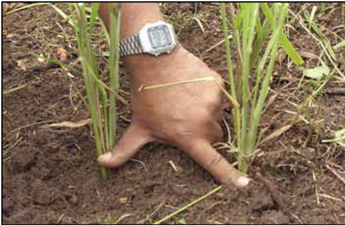
Uso del vetiver como barrera viva.