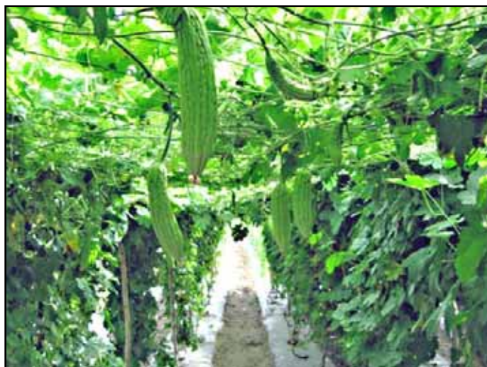
Tutorado de ramada en cundeamor chino.

reforzada con un zigzag de cabuya para mantener la tensión de la misma.