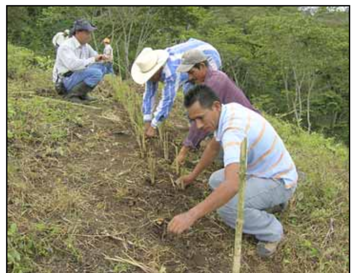
Trazado de barreras vivas en laderas.