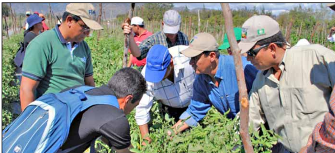
Los estudios en ejecución sobre el comportamiento de variedades de tomate de proceso y consumo fresco, fueron del interés de los participantes.