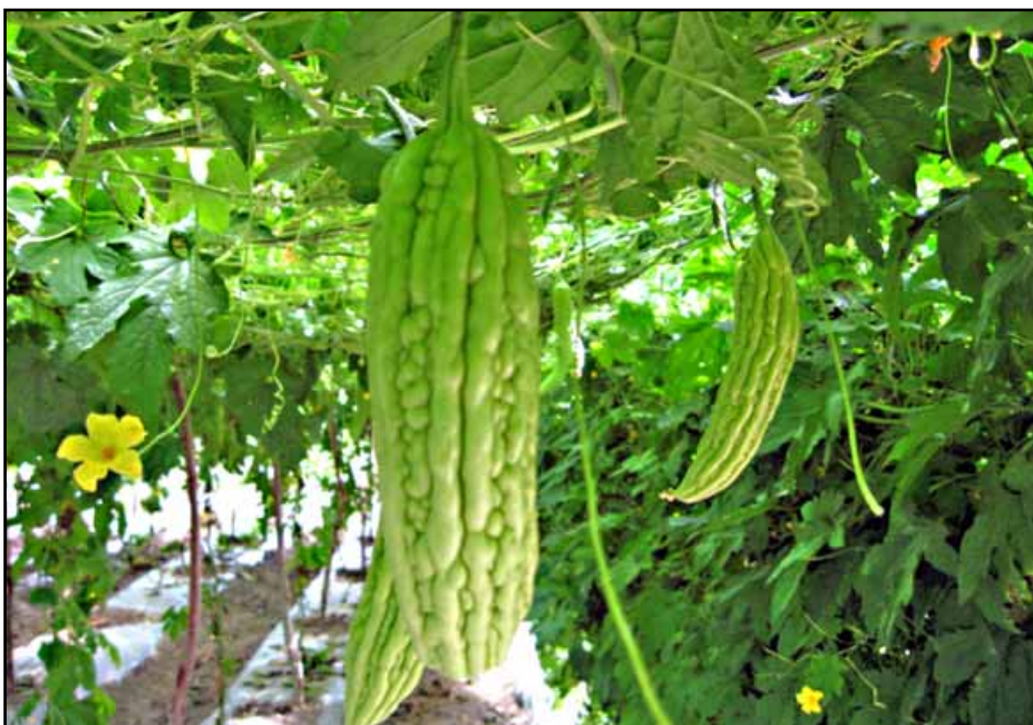
Denso follaje se forma en el techo del tutorado de ramada.

En base a los resultados obtenidos en las condiciones en que se desarrolló este experimento, se puede concluir que en el manejo del cundeamor chino no es conveniente sustituir el tutorado de espaldera tradicionalmente utilizado por los productores en el valle de Comayagua, por el tutorado de ramada.