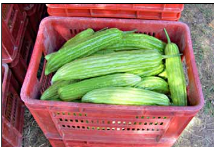
Frutos de cundeamor chino.

Esta es una planta monoica de polinización abierta la cual se lleva a cabo principalmente por abejas. Produce sus primeras flores entre los 35 y 55 días después de la siembra (dds) manteniendo la floración por espacio de 6 meses. Las cosechas normalmente inician en la octava semana (2 meses después del trasplante (ddt) alcanzando el pico de producción entre la 11 y 12va semana (3 meses ddt). Los volúmenes de producción varían dependiendo del cultivar, condiciones ambientales y prácticas agronómicas; sin embargo, cosechas de 20,000 a 30,000 kg/ha son comunes. La cosecha se hace cuando sus frutos están tiernos o fisiológicamente inmaduros, los cuales son ricos en vitaminas A, B, C y minerales como el calcio, fósforo, potasio y hierro. Los frutos son de sabor amargo debido al aumento en la concentración del alcaloide momordicina, y cuando están maduros liberan en el ambiente la hormona volátil etileno la cual acelera el proceso de maduración de los frutos adyacentes.