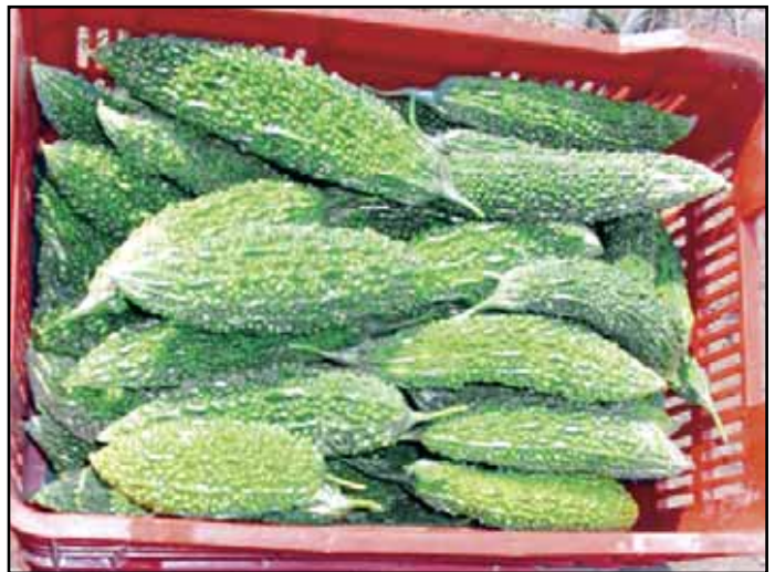
Frutos de cundeamor hindú.

Los frutos de buena calidad deben tener una apariencia fresca, firme, con una coloración externa verde y uniforme, libres de defectos visibles y sin semillas muy desarrolladas. Entre los defectos que aumentan el porcentaje de fruta de rechazo están la sobre maduración, el desarrollo excesivo de la semilla, coloración desuniforme, amarillamiento, ablandamientos, deformaciones y raspaduras y/o rayado ocasionadas por el roce de las frutas con las guías y la presencia de larvas ( Spodoptera sp.).