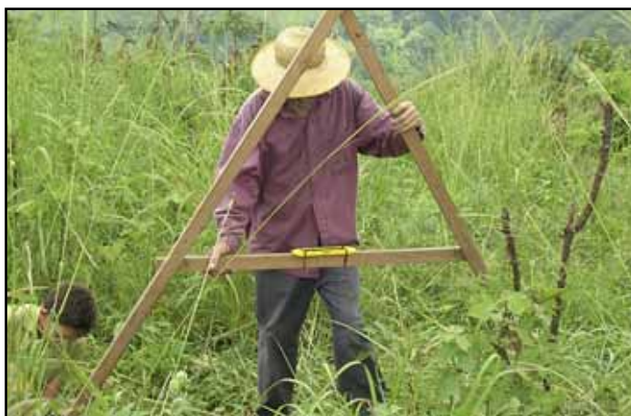
Productores capacitándose en la construcción de estructuras de conservación de suelos y trazado de plantaciones en laderas.

Como parte de las actividades de capacitación programadas se realizó también una gira educativa por la costa atlántica del país, durante los días 11 y 12 de noviembre de 2009. Se visitó el Centro Agroforestal Demostrativo del Trópico Húmedo (CADETH) de la FHIA, ubicado en la cordillera Nombre de Dios, en el departamento de Atlántida, para observar el funcionamiento de diferentes técnicas de conservación de suelos, el manejo de plantaciones adultas de frutales en laderas y el manejo de diferentes sistemas agroforestales con linderos de especies forestales. La gira también incluyó la visita a la finca de un pequeño productor ubicado en laderas similares a las de El Merendón, en las que maneja los cultivos de plátano, rambután y especies maderables en sistema agroforestal. La gira concluyó con la visita al Centro Experimental y Demostrativo del Cacao (CEDEC), en La Masica, Atlántida, para observar el manejo de viveros, plantaciones de cacao en asocio con