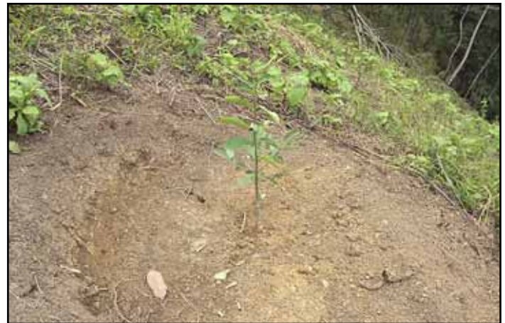
Construcción y uso de terrazas individuales para la siembra de frutales.