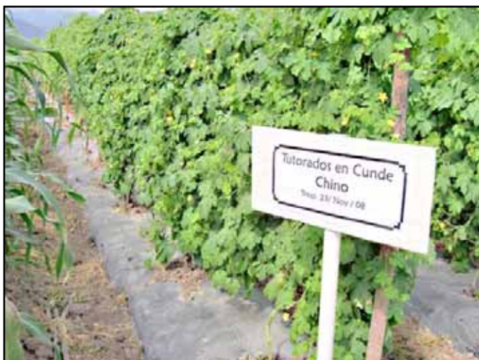
Tutorado de espaldera en cundeamor chino.