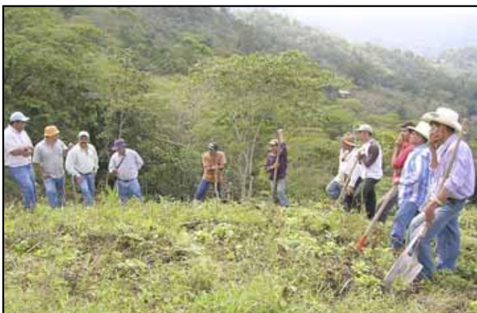
Los productores motivados se involucran en el proyecto.

Para iniciar las labores se realizaron dos reuniones de socialización del proyecto, en las que se explicó a los participantes de las diferentes comunidades los objetivos del mismo, obteniéndose de parte de ellos una reacción positiva y espontánea de participación. Inmediatamente después se procedió a la elaboración del estudio de línea base para conocer en detalle la situación inicial de las familias participantes, y posteriormente se analizó en forma participativa en cada comunidad las actividades de producción a desarrollar, con enfoque agroforestal, considerando prioritarias aquellas que tengan un impacto en la conservación de los recursos naturales y en el incremento de los ingresos familiares.