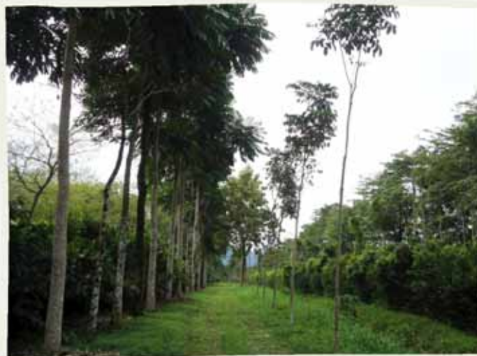
Camino interno del CEDEC-JAS sembrado con caoba angoleña (izquierda) y caoba hondureña (derecha).

En este caso las parcelas están conformadas por cada una de las especies forestales, sembradas a distancias de 5 o 6 m en hilera simple. A partir del segundo año se inició la toma de datos sobre el desarrollo de las especies, usando Pie de Rey y cinta diamétrica para registrar los incrementos anuales del diámetro (en centímetros) a 1.30 m del suelo y vara telescópica y clinómetro para medir la altura (en metros). Al momento de analizar estas variables en cada parcela, se descartan los datos tomados de los árboles ubicados en los extremos.