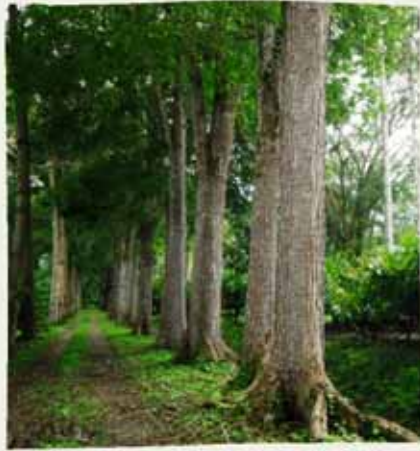
Árboles de caoba del atlántico en linderos internos del CEDEC-JAS.

La información obtenida evidencia que a los 26 años de edad el laurel negro produce la cantidad de 657 m 3 /km lineal (Cuadro 1). Sin embargo, otras especies como el sangre rojo, el pochote o cedro espino y el san juan de pozo, alcanzan rendimientos similares (635, 618 y 617 m 3 /km lineal, respectivamente) pero a la temprana edad de 18 años.