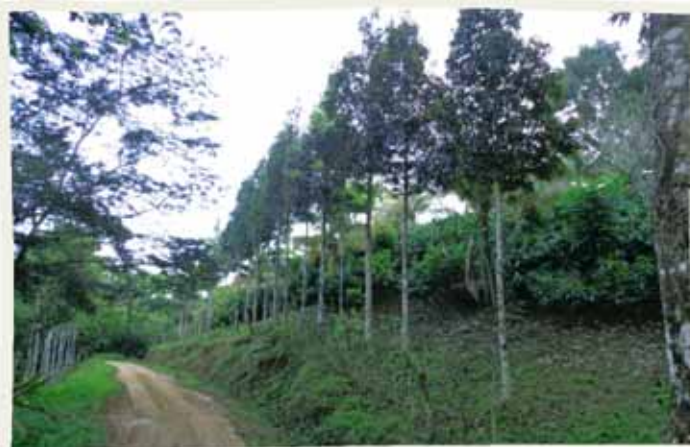
Caoba del atlántico (izquierda) y redondo (derecha) en linderos internos y externos del CADETH.