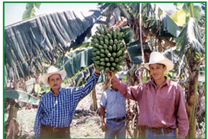
Pequeños productores hondureños y de otros países encuentran en los híbridos de banano y plátano de la FHIA, una fuente de nutrientes para contribuir a la seguridad alimentaria.

En 1998 se reportó que en Cuba se tenían cultivadas unas 8,000 hectáreas con los híbridos de la FHIA, esa cantidad se había incrementado en 1999 a 9,116 hectáreas y actualmente se