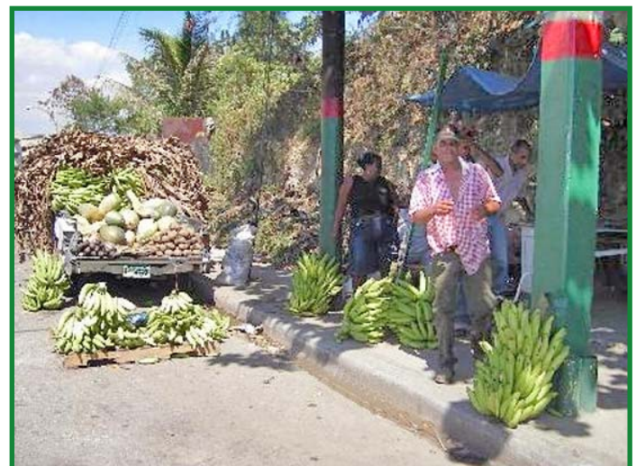
En República Dominicana también hay cultivadas unas 2,200 hectáreas de plátanos de la FHIA, especialmente el FHIA-21, que equivalen al 10% de la producción nacional y va en aumento. Muchos de estos plátanos se encuentran disponibles en lugares populares de venta en casi todas las ciudades del país.