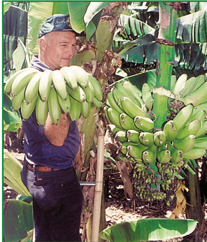
El Dr. Philip Ray Rowe (Q.D.D.G.) uno de los más destacados fitomejoradores del mundo, mostrando un racimo del híbrido FHIA-03 (moroca) que él desarrolló en la FHIA y que es uno de los bananos de mayor aceptación por los productores y consumidores cubanos.

Estado cubano continuar la producción de banano y plátano, sin necesidad de utilizar productos químicos para el control de la Sigatoka. Esto ha traído grandes beneficios a Cuba, ya que los productores generan un promedio conservador de 500,000 toneladas métricas de fruta fresca por año para consumo interno, lo cual tiene un impacto significativo en la seguridad alimentaria de la población cubana. El beneficio económico derivado de la utilización de los híbridos de la FHIA equivale a unos 10 millones de dólares por año, es decir, unos 190 millones de Lempiras anuales.