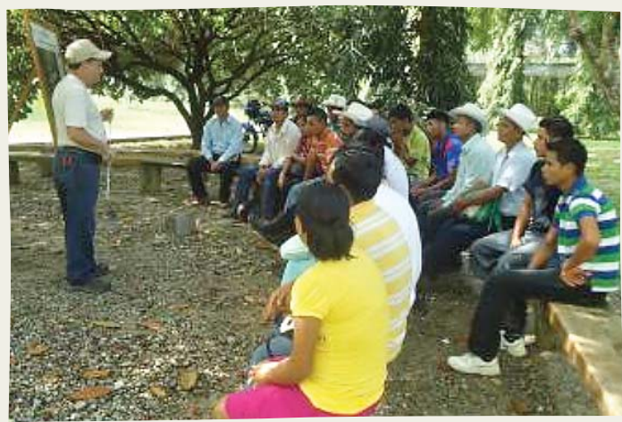
Los productores hasta ahora seleccionados ya iniciaron su capacitación en uno de los centros experimentales de la FHIA.