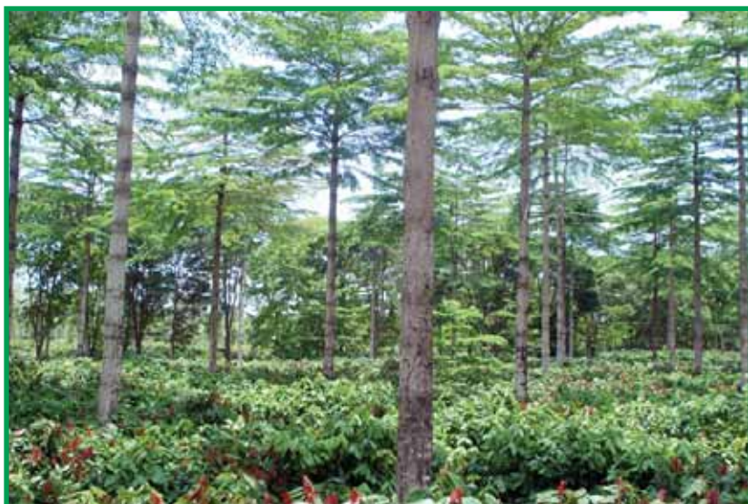
Producción de cacao asociado con limba en el CEDEC.

El Dr. Martínez explicó que este proyecto promoverá los sistemas agroforestales con cacao, que siguen prácticas ambientales sostenibles y disminuyen el impacto de la actividad humana. Indicó que la ejecución del proyecto incluye la promoción, organización y apoyo a las comunidades beneficiadas, involucrando directamente a los participantes en su planeación e implementación. “Este proyecto se ejecutará en un periodo de 6 años en 24 municipios de los departamentos de Atlántida, Colón, Cortés y Santa Bárbara. Estos cuatro departamentos poseen regiones con las características agro ecológicas idóneas para el cultivo de cacao, localizadas al pie de monte de la costa norte de Honduras, y ya se han establecido las rutas de trabajo en la zona de cobertura del proyecto”, agregó el Dr. Martínez.