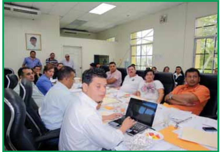
Socialización con autoridades municipales de Puerto Cortés y otras instituciones locales.