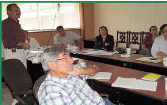
Reunión del Consejo Directivo del proyecto.

De manera similar, para asegurar la eficiente ejecución del proyecto, también se ha conformado un Comité Técnico en el que participan las siguientes instituciones: