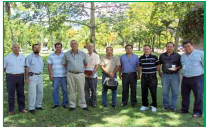
Directivos de FHIA y miembros del Comité Técnico del proyecto.