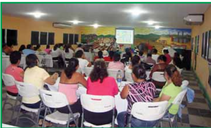
Socialización con grupo de productoras en la zona de Agua Blanca, Yoro. En esta reunión también participó el Ing. Jacobo Regalado, Ministro de la SAG.

Para aprovechar al máximo el tiempo disponible, durante los meses de septiembre y octubre de 2010 se ha contratado al personal técnico necesario y se ha iniciado la socialización del proyecto en varios municipios de la zona de influencia, con la participación de centenares de productores y productoras interesados(as) en involucrarse en el proyecto, representantes de las respectivas corporaciones municipales y representantes de otras instituciones locales, a quienes se les han presentado los detalles del proyecto, se han descrito los diferentes componentes y se les ha motivado a participar en el desarrollo del mismo. Como resultado, ya se inició el registro de los productores(as) y la actualización de la línea base, como punto de partida en la ejecución del plan operativo establecido.