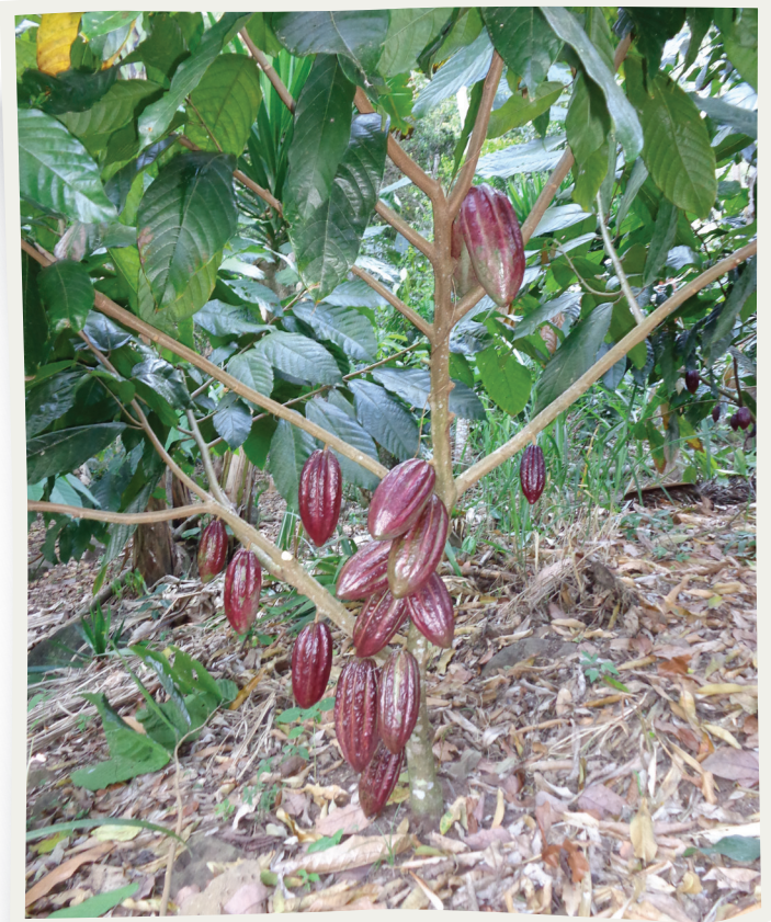
Producir cacao fino de calidad es clave para obtener una buena comercialización.

FHIA con el apoyo de la empresa Chocolats Halba y la Fundación Helvetas Honduras, ha identificado las áreas del país con potencial para la producción de cacao y se ha estimado que el departamento de Atlántida tiene todavía un alto potencial para la producción de este cultivo sin mayores dificultades.