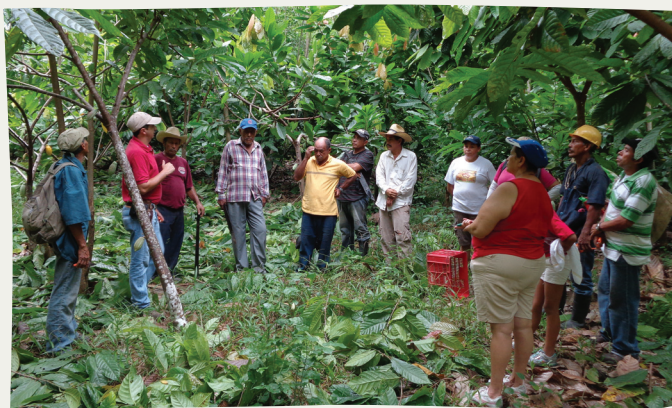
Hombres y mujeres dedicados al cultivo del cacao en el departamento de Atlántida, reciben asistencia técnica a través del Proyecto de Cacao FHIA-Canadá.

Esto muestra un incremento en beneficios económicos sobre todo a los pequeños y medianos productores brindando nuevas oportunidades de desarrollo sostenible a cientos de familias cacaoteras y al mismo tiempo generando empleos para el beneficio de otras personas, además de contribuir a la reforestación y protección del medio ambiente.