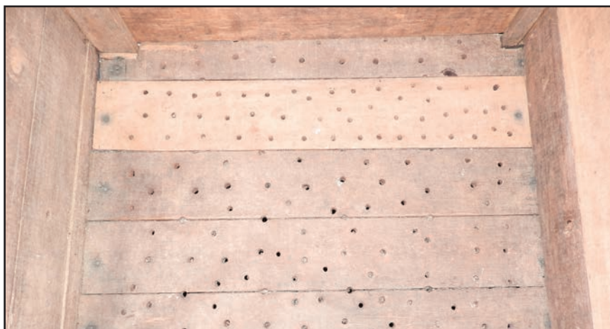
Cajón fermentador mostrando el fondo con orificios.

Llene el cajón hasta 5 cm o 10 cm del borde superior y tape con hojas de plátano. Esto ayuda a mantener el calor necesario en la fermentación. Use un termómetro, es de esperar que la temperatura suba y se mantenga arriba de 45 °C a partir del tercer día.