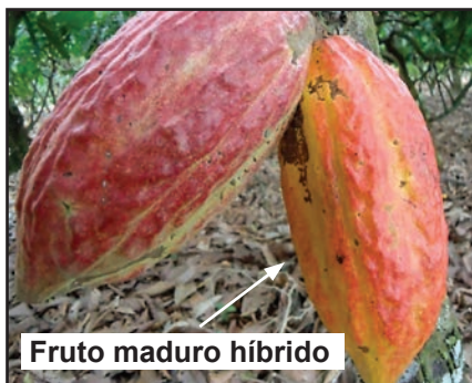
Fruto maduro híbrido

Frutos mostrando su cambio de coloración durante el proceso de maduración.