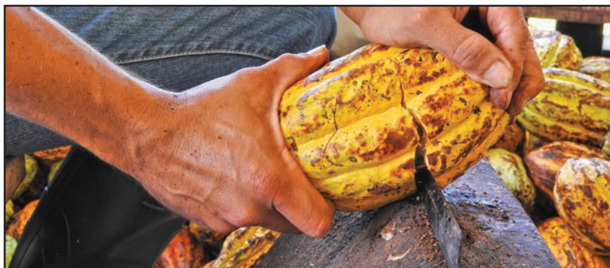
Quebrado correcto del fruto.

El quebrado de la mazorca debe hacerlo con cuidado para no dañar el grano. Haga esto a más tardar 2 días después de su cosecha. No mezcle granos cosechados en diferentes días. Al extraer el grano evite que lleve material extraño como pedazos de cáscara, ramillas, tierra y placentas o tripas. El grano extraído en baba se deposita en recipientes limpios de madera, plástico o en sacos con forro de plástico; no use recipientes de metal.