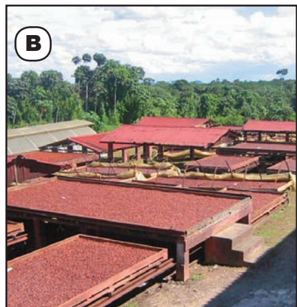
Secado del grano en gavetas corredizas (A) y en tendales en secadora solar (B).