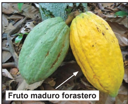
Fruto maduro forastero

Toda mazorca madura (se conoce por el cambio de coloración de verde a amarillo o de rojo a anaranjado); así como las pintonas (inicia a madurar), enfermas o dañadas por pájaros y ardillas deben ser cosechadas. Use las herramientas adecuadas de cosecha.