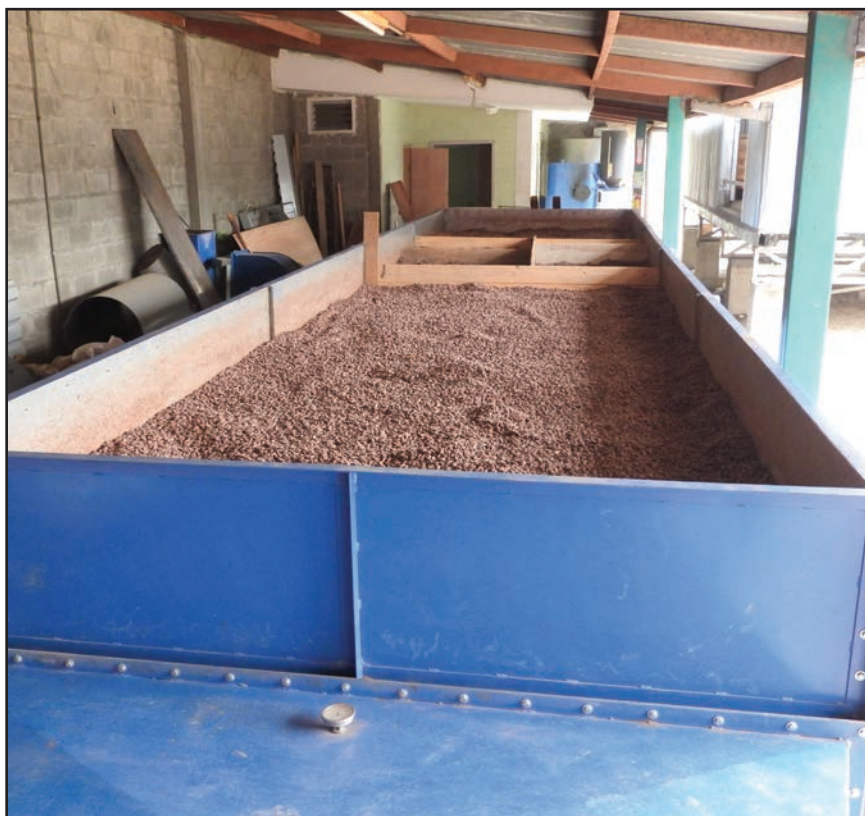
Secado artificial del grano del cacao.

Si la lluvia y la nubosidad no permiten secar el cacao, llévelo rápidamente a secar a una secadora artificial. Se empieza el secado a 40 °C, suba la temperatura gradualmente hasta un máximo de 55 °C. Al igual que el secado al sol, hay que remover el grano cada 20 a 30 minutos. Por ningún motivo permita que el grano se ahúme o adquiera olores extraños como a orín, a rincón, gasolina o agroquímicos; todos ellos representan defectos que la industria rechaza.