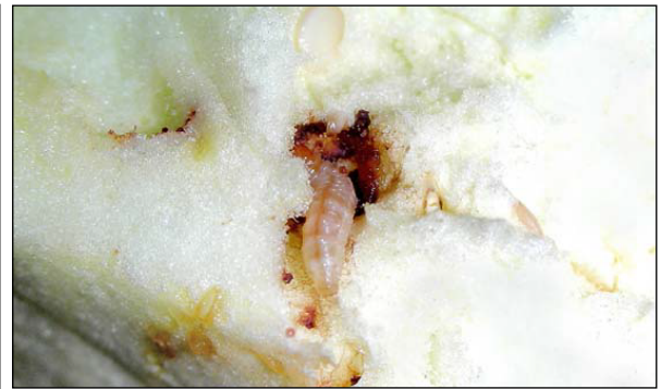
Figura 4. Larva de Neoleucinodes elegantalis : daño de barrenación causado en fruta de berenjena.